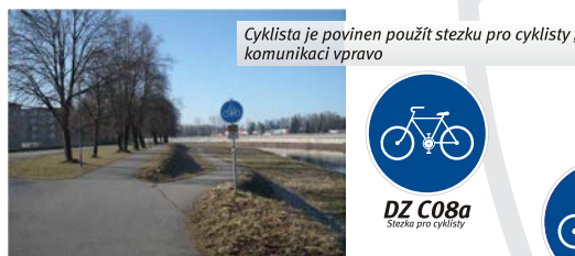
Cyklista je povinen použít stezku pro cyklisty, komunikaci vpravo

Kromě cyklistů smí stezku pro cyklisty užívat i osoby pohybující se na koloběžkách, kolečkových bruslích, na lyžích nebo obdobném sportovním vybavení (dále jen cyklisté).