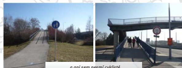
...a ani sem nesmí cyklisté

Jízda cyklistů po stezce pro chodce je zakázána. Chce-li cyklista stezku pro chodce užít, musí kolo vést.