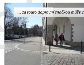
... za touto dopravní značkou může cyklista opět nasednout

Jízda cyklistů po přechodu pro chodce je zakázána. Chce-li cyklista užít k překonání vozovky přechod pro chodce, musí kolo vést.