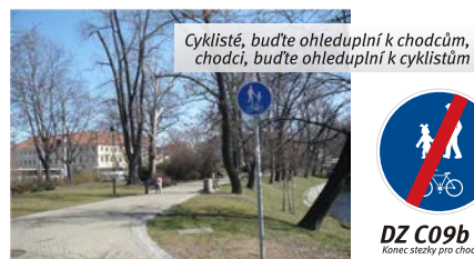
Cyklisté, buďte ohleduplní k chodcům, chodci, buďte ohleduplní k cyklistům

Na stezce pro chodce a cyklisty je cyklista povinen počínat si tak, aby neohrozil chodce jdoucí po stezce, a chodec nesmí svým chováním ohrozit cyklisty jedoucí po stezce.