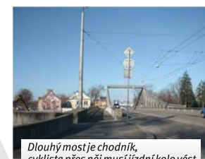
Dlouhý most je chodník, cyklista přes něj musí jízdní kolo vést

Po chodníku smí na kole jezdit pouze děti mladší 10 let.