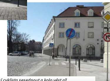
Tady musí cyklista sesednout a kolo vést až k protější budově, kde znovu stezka pro cyklisty začíná...