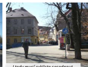
I tady musí cyklista sesednout